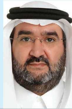
د. عبد العزيز بن عثمان بن صقر

الأمم المتحدة يتم تغييبها عن عمد تجاه قضايا المنطقة وبفعل فاعل من القوى الكبرى، وكذلك لضعف وهشاشة المنظمة